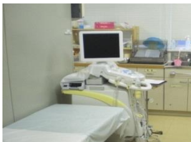
当院整形外科外来のエコー装置

関節リウマチでお困りの方や、関節エコーを一度も受けたことのない関節リウマチ患者さんや、改善しない関節痛や関節炎のある方は、是非、一度、当院を受診してみてください。必ずや、治療の糸口が見つかるはずですよ。