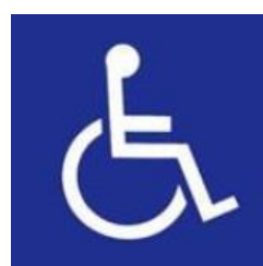
障害者のための 国際シンボルマーク

また、障害者の方や障害者の方の送迎などで障害者用駐車場をご利用の際は、それと判るように車体やダッシュボードなどに障害者シンボルマークなどを掲げて頂きますようお願いいたします。