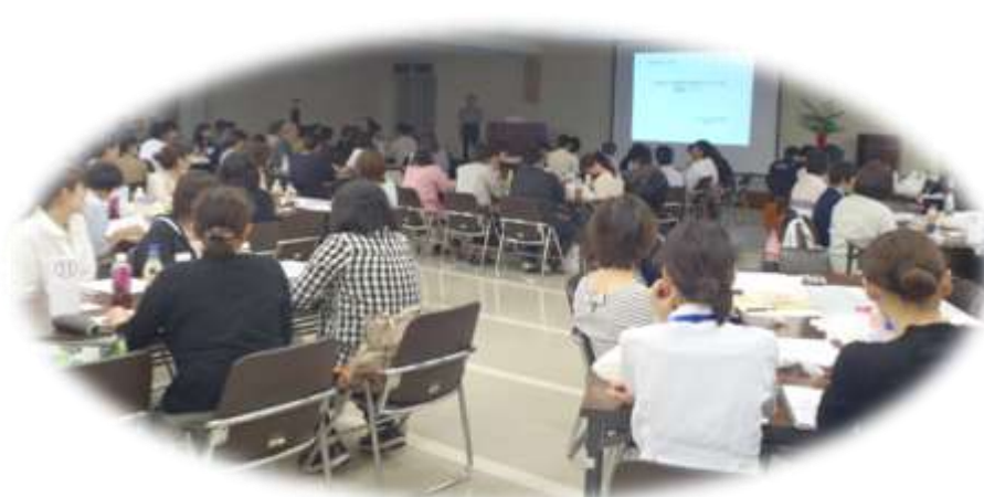
【患者・家族を支える多職種連携】

多職種が集まり知識の習得、そして顔見知りになりお互いの職種を理解する良い機会となりました。同じ目標をもって患者・家族を地域全体で支える関係づくりの大切さ、今回の研修が、はじめの一歩になればと思います。研修内容の一部をご紹介します。