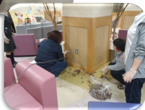
【手すりの清掃、普段目についでいなかった箇所の清掃】