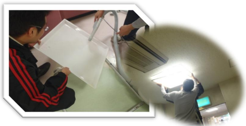
【蛍光灯のカバーの清掃】