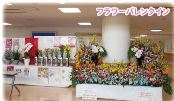
フラワーバレンタイン

患者さんはいつも私たち看護師の笑顔を待っています。そばに寄り添い、心の声に耳を傾ける看護を常に意識しています。患者さんを癒し、患者さんに癒される…そんな中で自分自身の看護を見つけてみませんか？