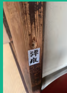
龍馬が撃った銃の弾痕