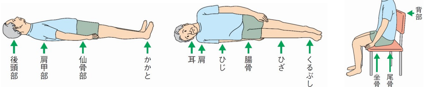
上図：日本褥瘡学会編：在宅褥瘡予防・治療ガイドブック第3版 照林社 2015より引用