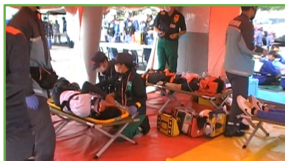
トリアージして応急処置を行う 長門総合病院 DMAT